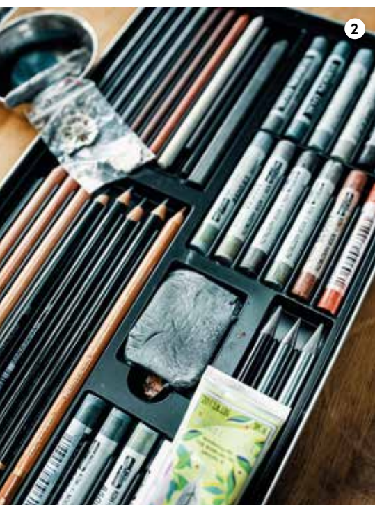
1/ KRESLENÍ Ve skicáku má Milada rozkreslené detaily různých květin. Důležité je předem si dobře promyslet proporce, aby květina působila opravdu skutečně, jako by byla do stříbra jen zakletá. 2/ MALÍŘSKÉ NÁŘADÍ Pro Miladu jsou to především tužky a uhly různé tvrdosti.