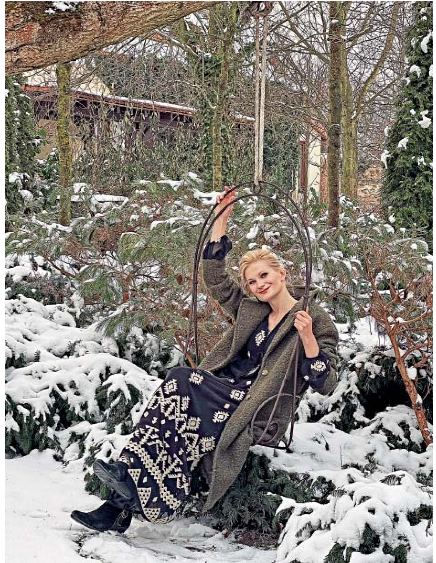
STYLING: IVANA PRAŽÁKOVÁ, MAKE-UP: MICHAELA OHEMOVÁ, BALMAIN HAIRCOUTURE, PRODUKCE: IVANA DRÁBŘOVÁ